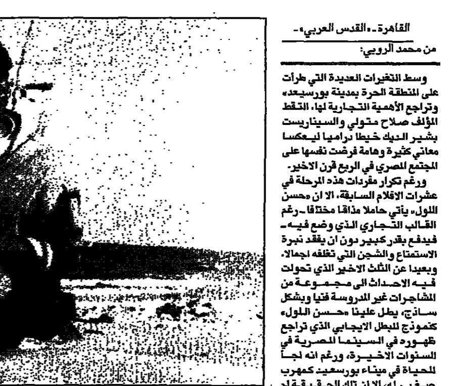
أحمد زكي وشيرين رضا في مشهد من الفيلم «القدس العربي»